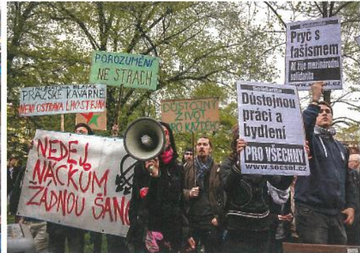
Tzv. migrační krize začala v roce 2015, kdy v zemích EU požádalo o azyl více než 1,25 milionu lidí. Společnost v Česku i v celé Evropě se ostře rozdělila na „vítací“ a odpráce přijímání uprchlíků. A to vinou politiků, kteří špatně vyhodnotili důsledky masové migrace, ale [jak potvrdily např. analýzy lipské univerzity] i vinou jednostranné rétoriky médií. Na snímku vlevo uprchlíci na vlakovém nádraží Keleti v Budapešti v září 2015. Vpravo demonstrace proti xenofobii a rasismu v dubnu 2016 v Ostravě.