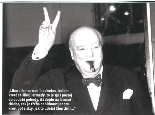
„Liberalismus není hodnotou, kolem které se šikují armády, to je spíš postoj do období pohody. Až dojde na lámání chleba, tak je třeba nabídnout jenom krev, pot a slzy, jak to udělal Churchill...“

torovi univerzity jste ji podal, přestože byl dříve v KSČ.